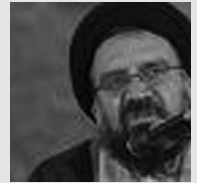
با ولایت فقیه است.